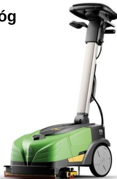
Osuszanie podłogi - jazda do przodu

Zmywarka do podłóg CT 5 polecana jest szczególnie do strefy HO.RE.CA., (hotel, restauracja, catering) ; świetnie sprawdzi się też przy myciu podłóg w dużym mieszkaniu i w domu oraz w biurze i gabinecie.